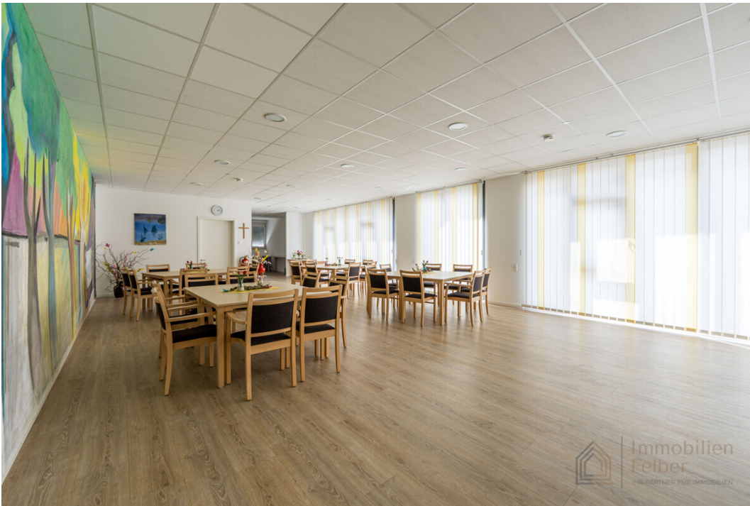
Gemeinschaftsraum im Erdgeschoss mit kleiner Küche