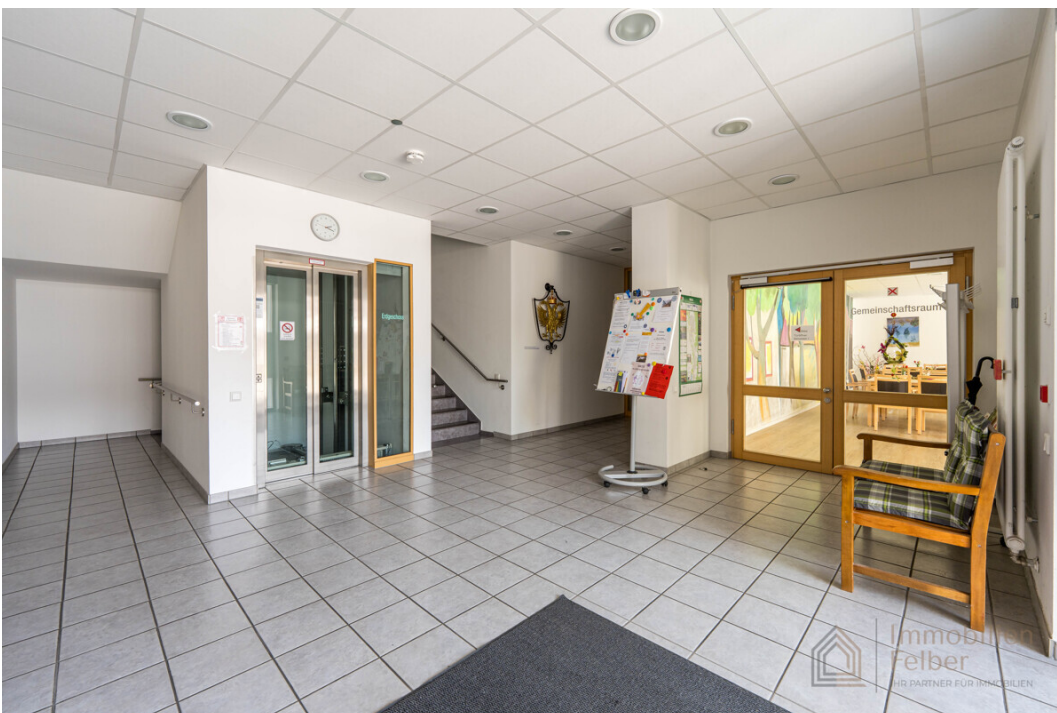
Eingangsbereich mit Infotafel über Veranstaltungen im Haus