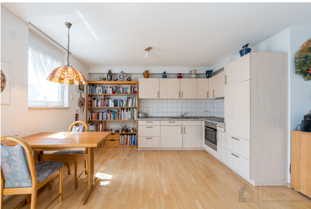
Einbauküche mit Essplatz