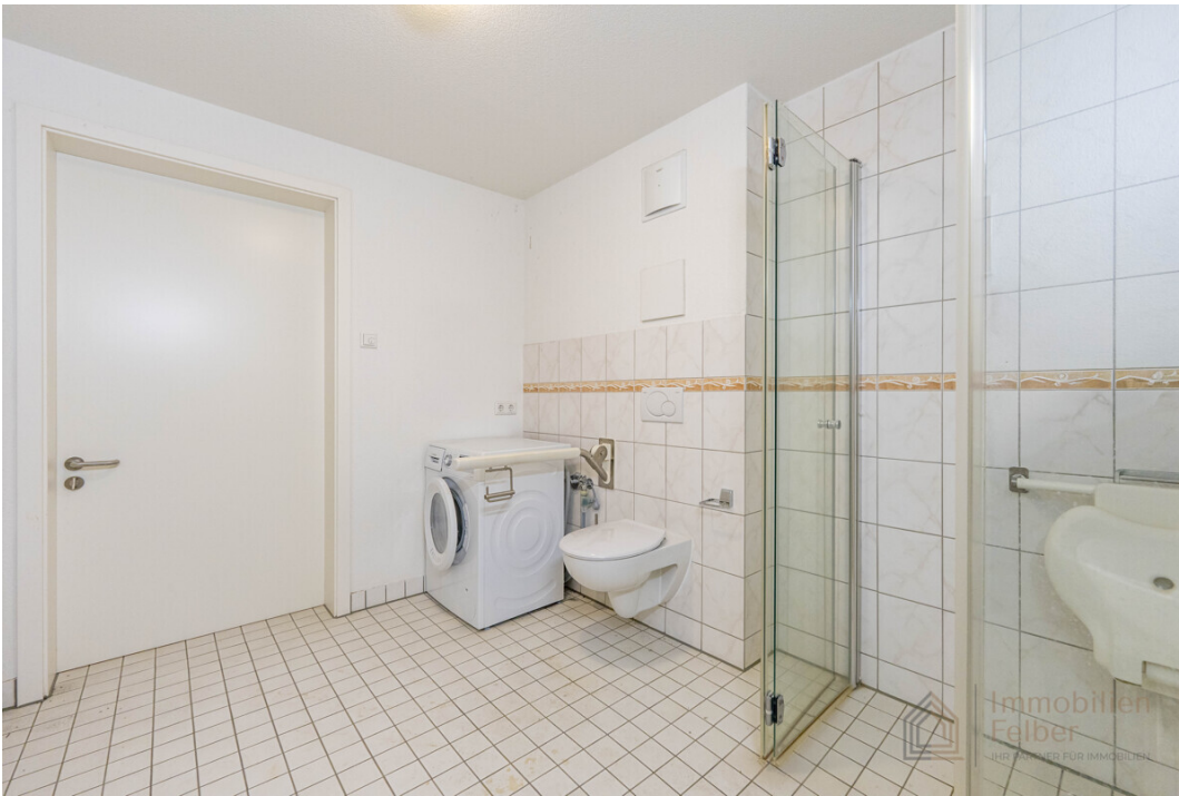
Badezimmer - Platz für die Waschmaschine