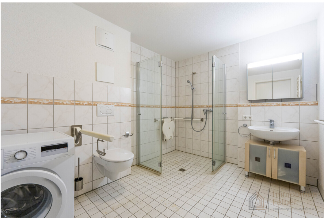
Badezimmer mit rollstuhlgerechter Dusche