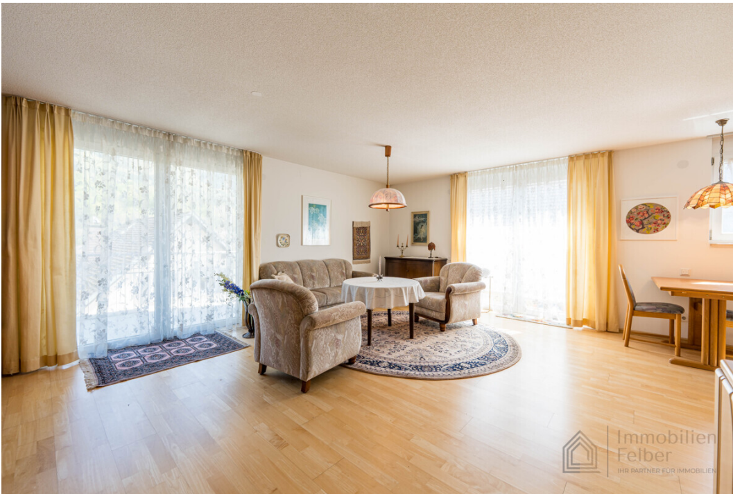
heller und großzügiger Wohnbereich