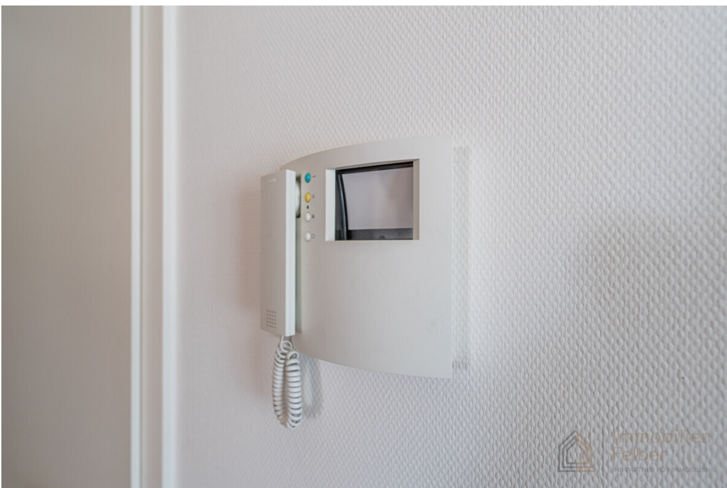
Türsprechanlage mit Kamera