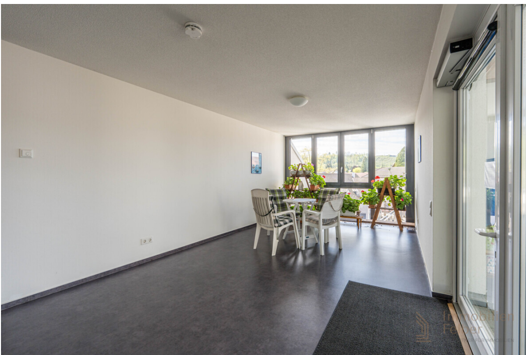
kleiner Sitzbereich im Dachgeschoss mit Blick nach Westen