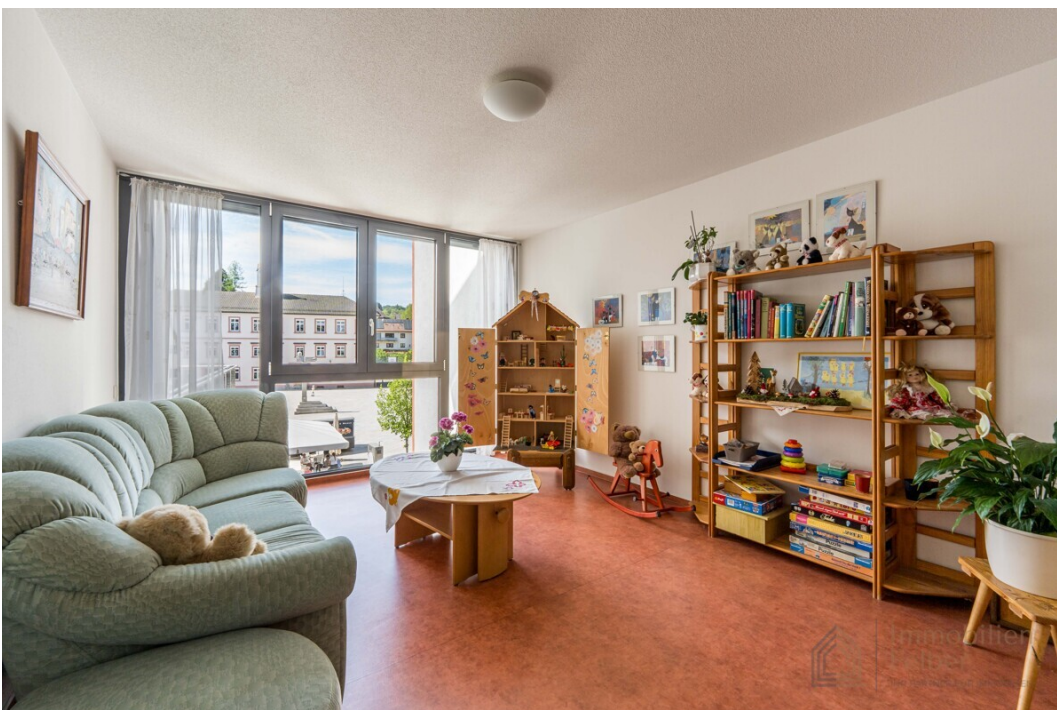
kleiner Aufenthaltsraum auf jeder Etage