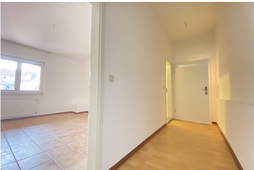
Diele - Blick zur Eingangstüre