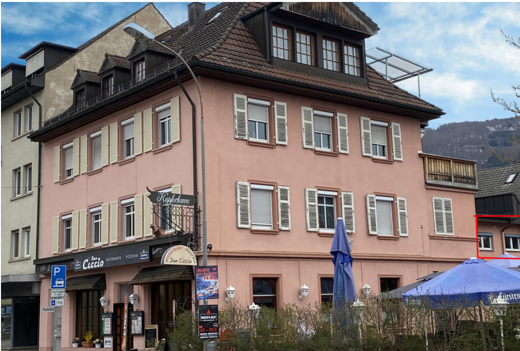
Wohnung im hinteren Bereich des Gebäudes