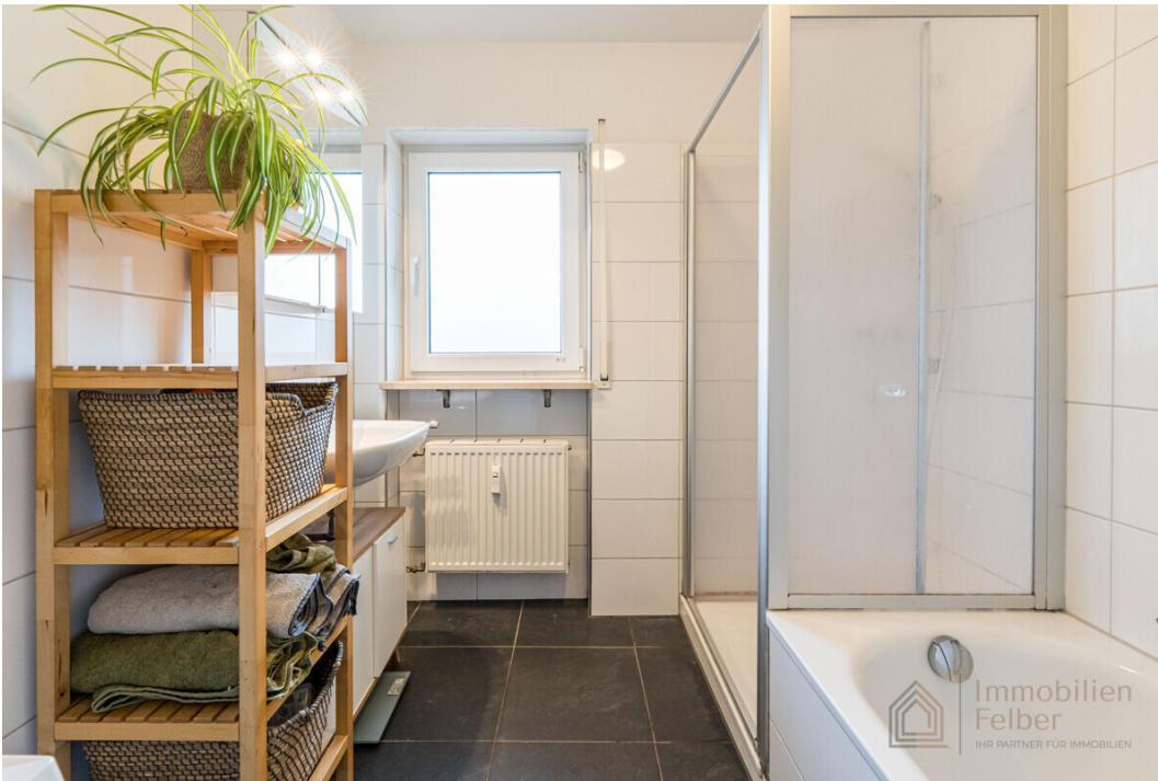
Badezimmer mit Dusche und Badewanne