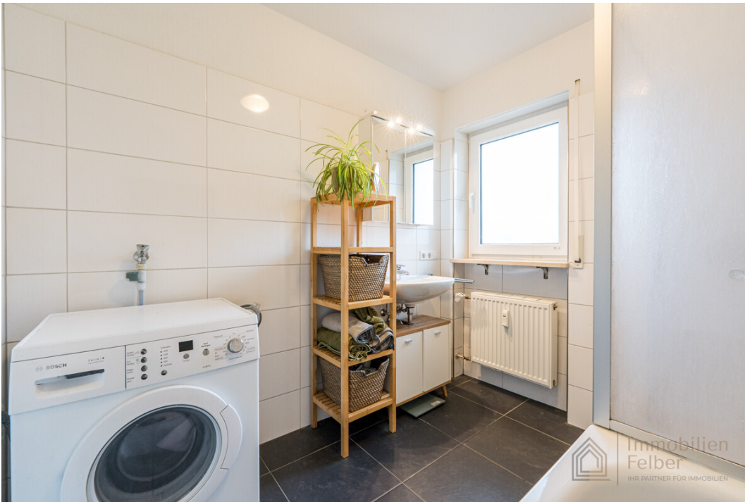
Badezimmer mit Platz für die Waschmaschine/Trockner