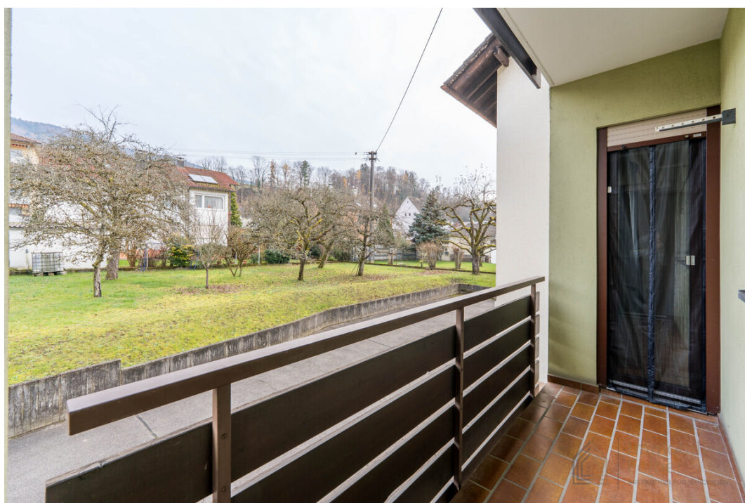
Balkon nach Osten