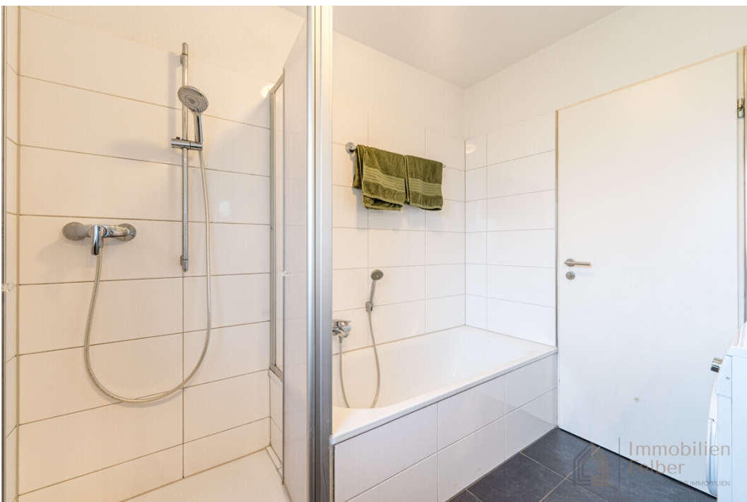
Badezimmer mit Dusche und Badewanne