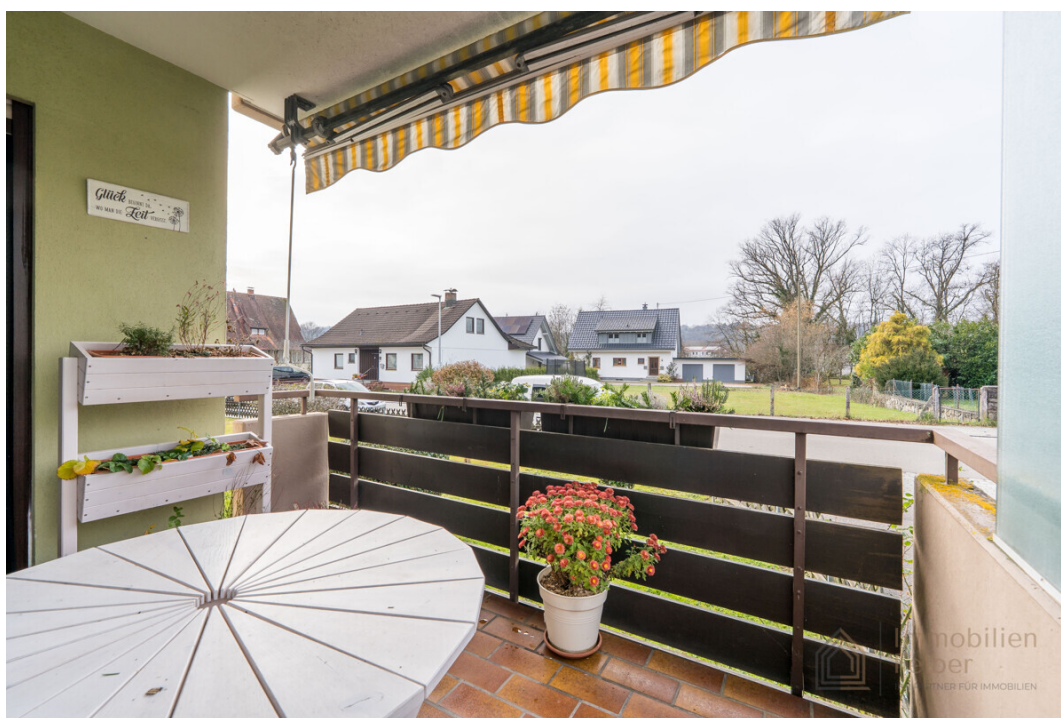
Balkon nach Westen

Immobilien Felber IHR PARTNER FÜR IMMOBILIEN