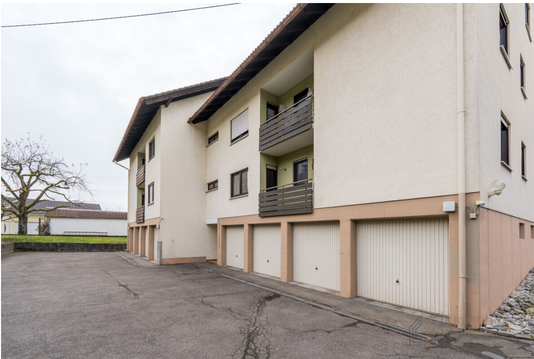
Ansicht Ost mit Garagen