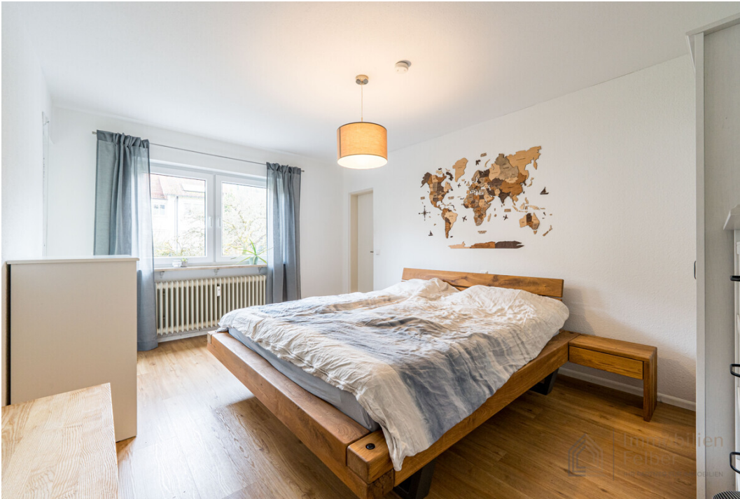
Schlafzimmer mit Abstellraum