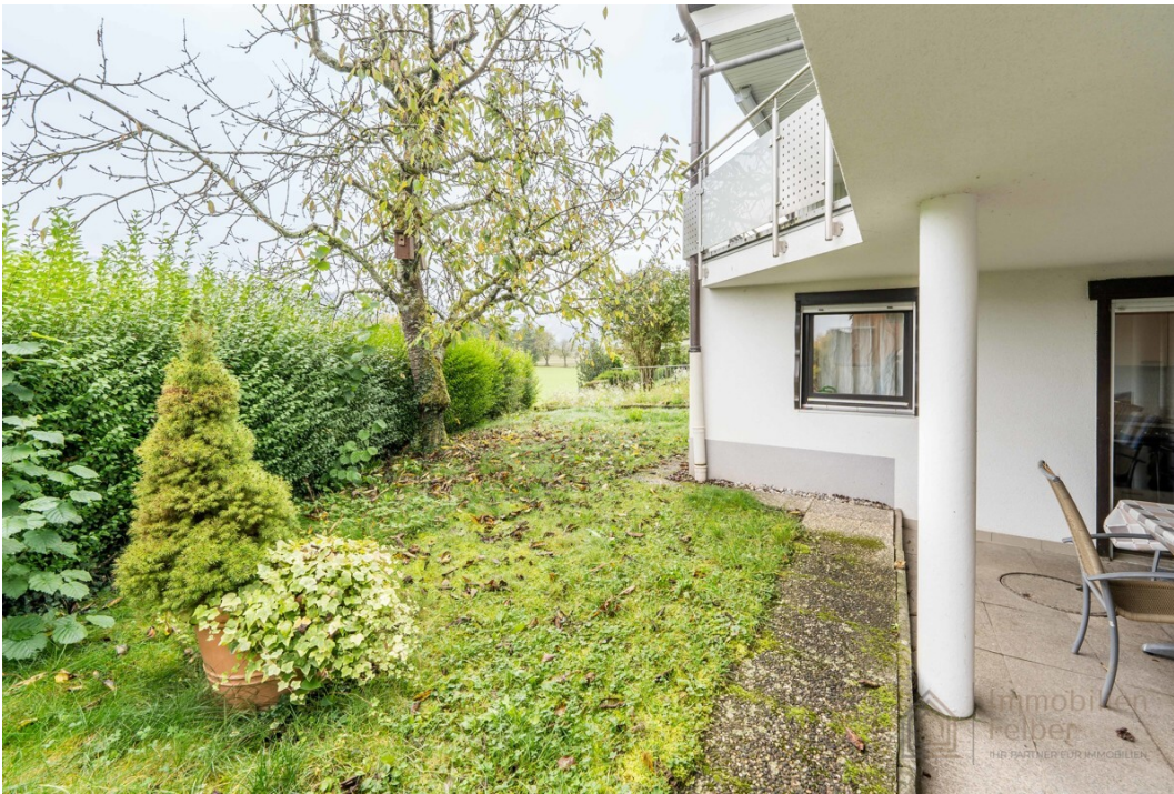
Terrasse mit Grünfläche