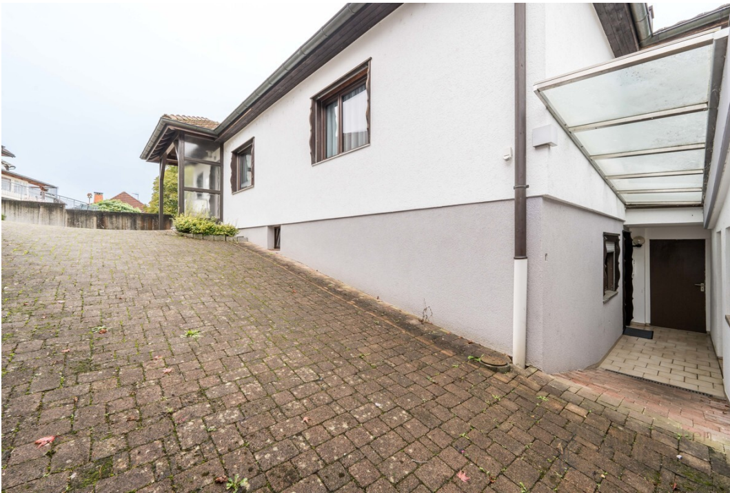
Garageneinfahrt mit Zugang zur Einliegerwohnung