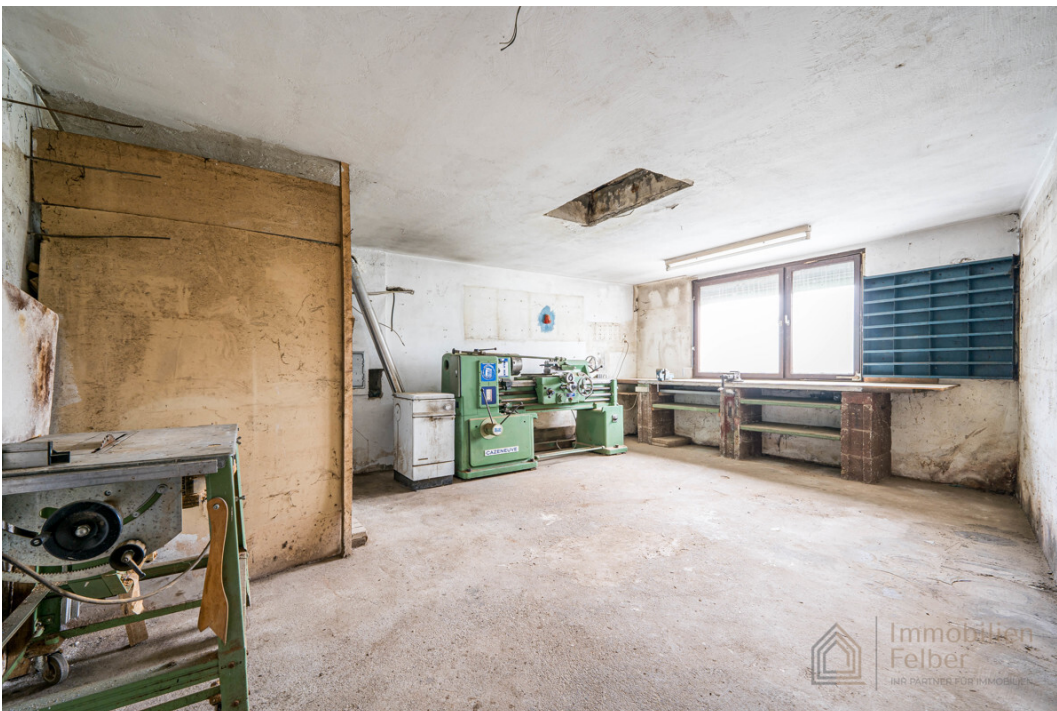
Hobbyraum unter Garage