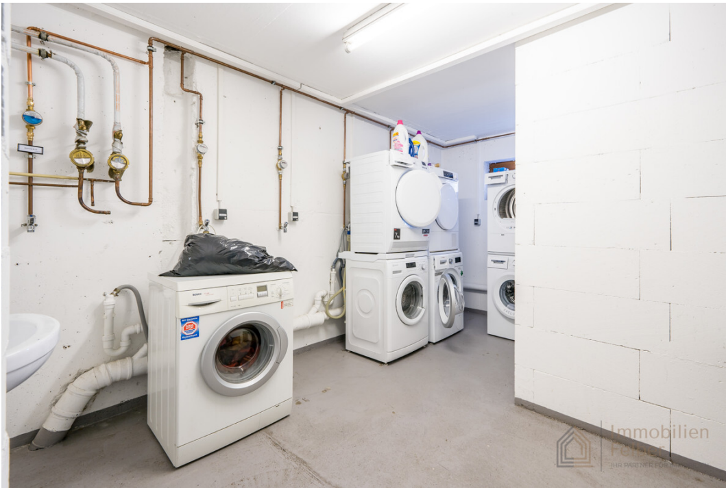
Platz für die Waschmaschine